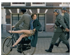
Zwartboek Winnaar van Het Gouden Kalf voor de beste film van 2006 (2-disc Special Edition)

6 van de beste Nederlandse speelfilms, nu te verkrijgen bij het AD voor de speciale prijs van slechts € 39,95.