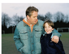
In Oranje Genomineerd voor Het Gouden Kalf voor de beste film van 2004