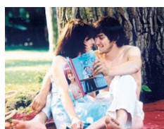
Phileine zegt sorry Genomineerd voor Het Gouden Kalf voor de beste film van 2003