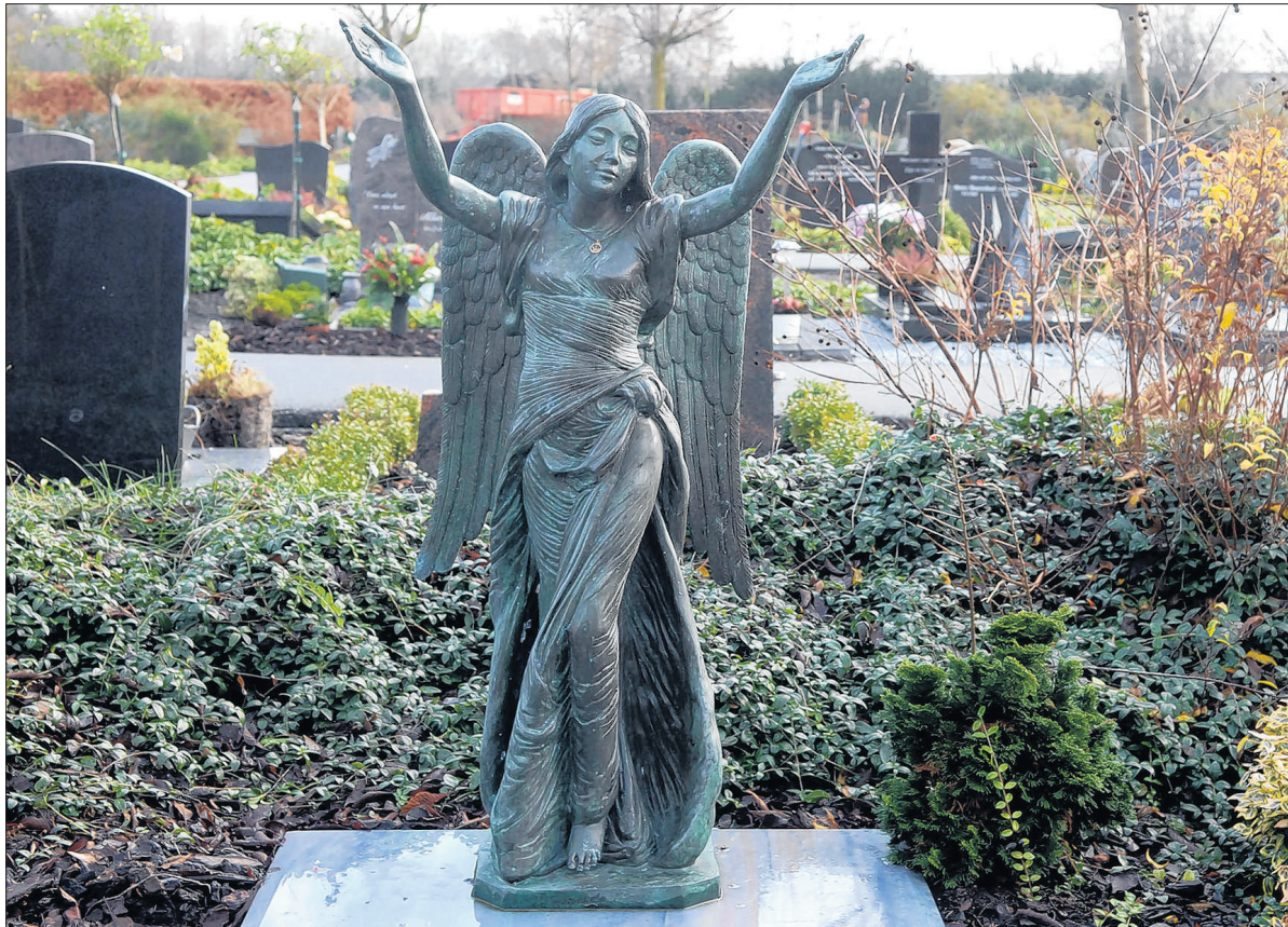
De halsketting van een engel verwijst naar de brief van Paulus over geloof, hoop en liefde.

Om diezelfde reden bezoekt haar nicht ditzelfde graf onder een kale